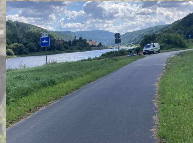
Fahrt in die böhmische Schweiz