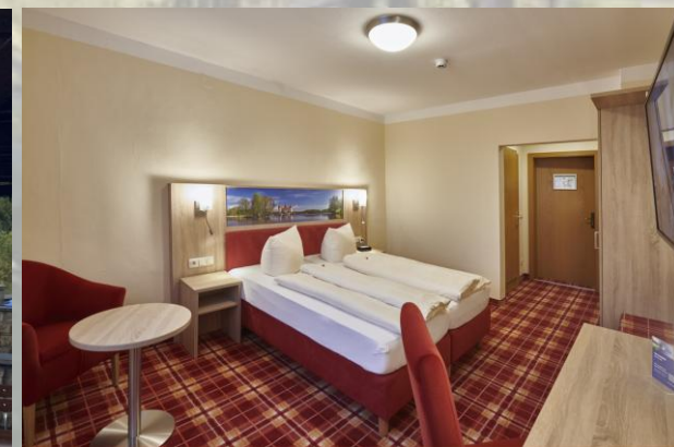
Die Zimmer sind perfekt