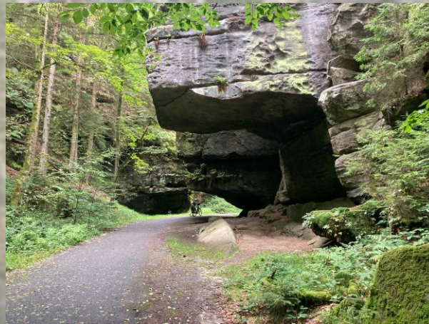
Auffahrt zur Bastei