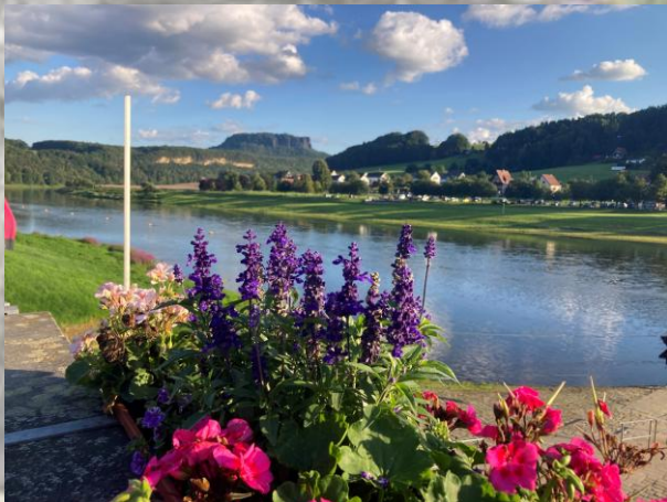
Rathen am Elbradweg

Wir haben es getestet, bei jedem Ziel wirst Du mit einem tollen Ausblick belohnt.