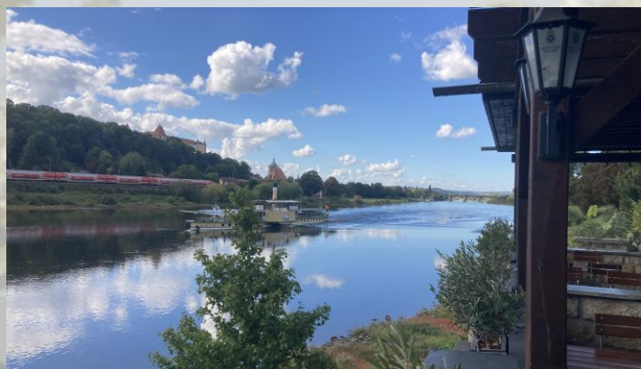
Blick vom Biergarten