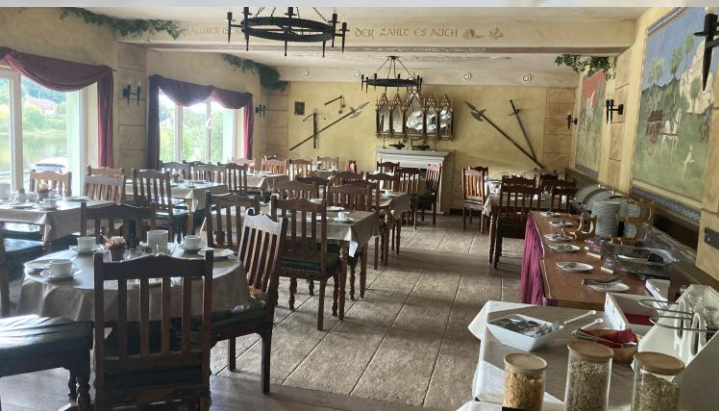
Frühstücksraum mit Blick auf die Elbe

23 Doppelzimmer, 5 Einzelzimmer, 1 Dreibettzimmer Preis: 89,-Euro/Person/Nacht Der Preis beinhaltet Frühstück, Halbpension (Abendessen nach a la Carte), Parkplatz, Kurtaxe, 5 Tage steht das Hotel einschließlich Biergarten dem Verein zur Verfügung, Sollte die Bettenkapazität nicht ausreichen gibt es Pensionen in der Nähe, wir organisieren das, Generell: Vergabe der Zimmer nach Reihenfolge der Anmeldungen. Zimmerpreis ist nach Auslastung des Hotels berechnet und beinhaltet zusätzlich die Halbpension.